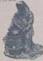
imagen que evoca nostalgia y calidez, representando una actividad muy típica en España durante los meses fríos: la venta de castañas.

así como en las calles. Las castañeras eran mujeres que asaban y vendían castañas en las calles durante el otoño y el invierno. En Burgos, esta figura está vinculada a la suba costumbres de autabú, cuando estas vendedoras se instalaban en las esquinas para ofrecer un alimento cálido y económico.