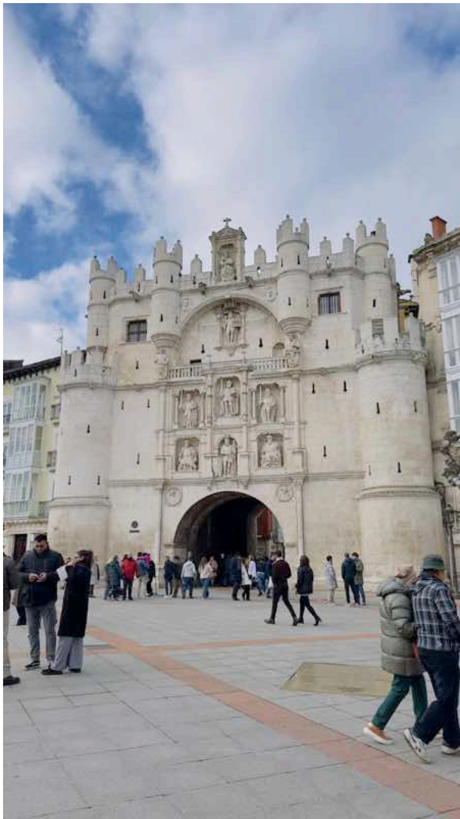
Porta di Santa Maria

Un tour privato a piedi del centro storico completo richiede circa 2 ore.