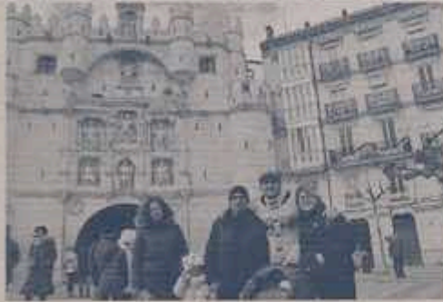
Una escena del film en la zona del casco antiguo de Burgos, 1993. © J. J.