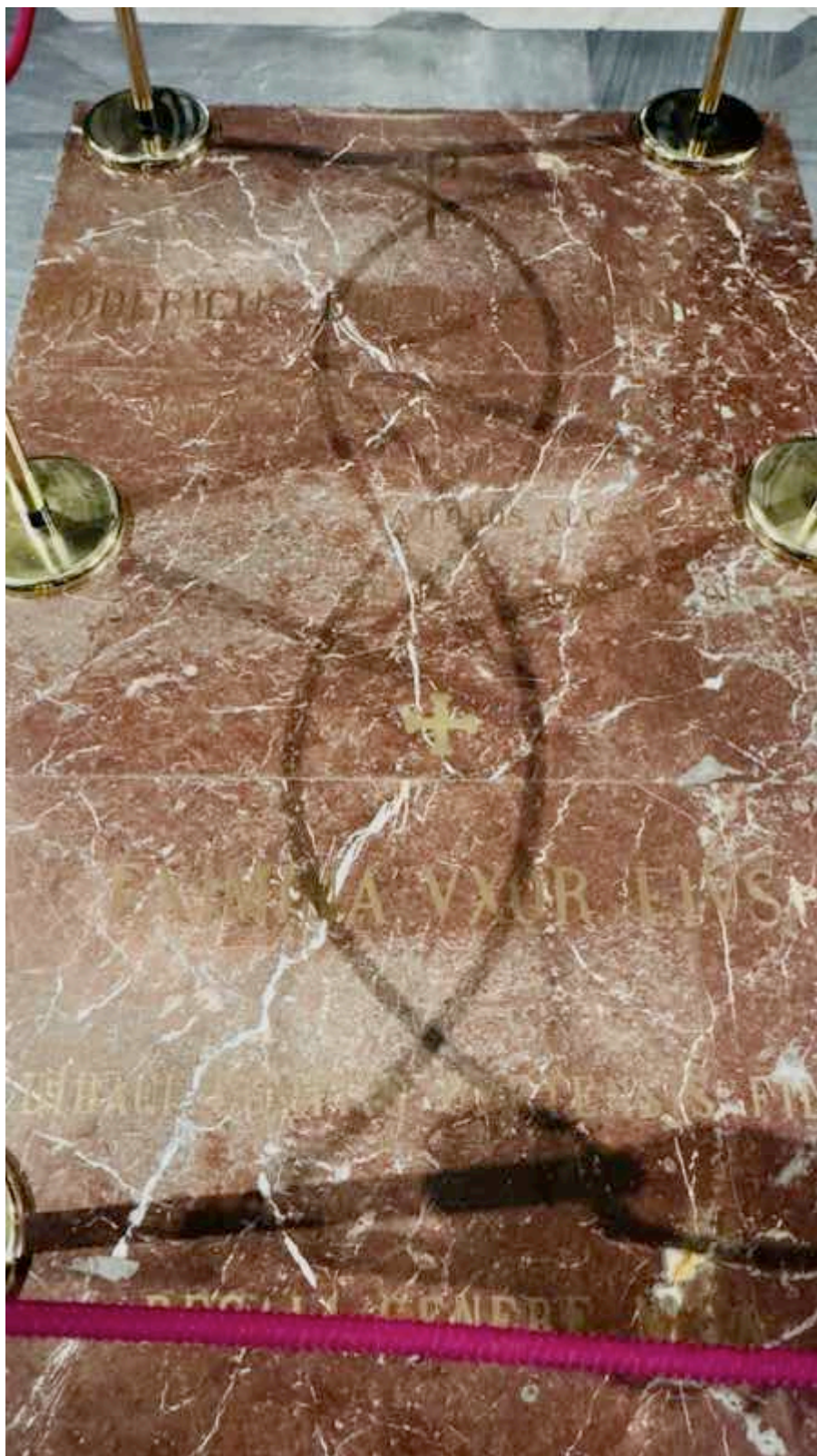
Cattedrale Santa Maria Tomba del Cid Campeador