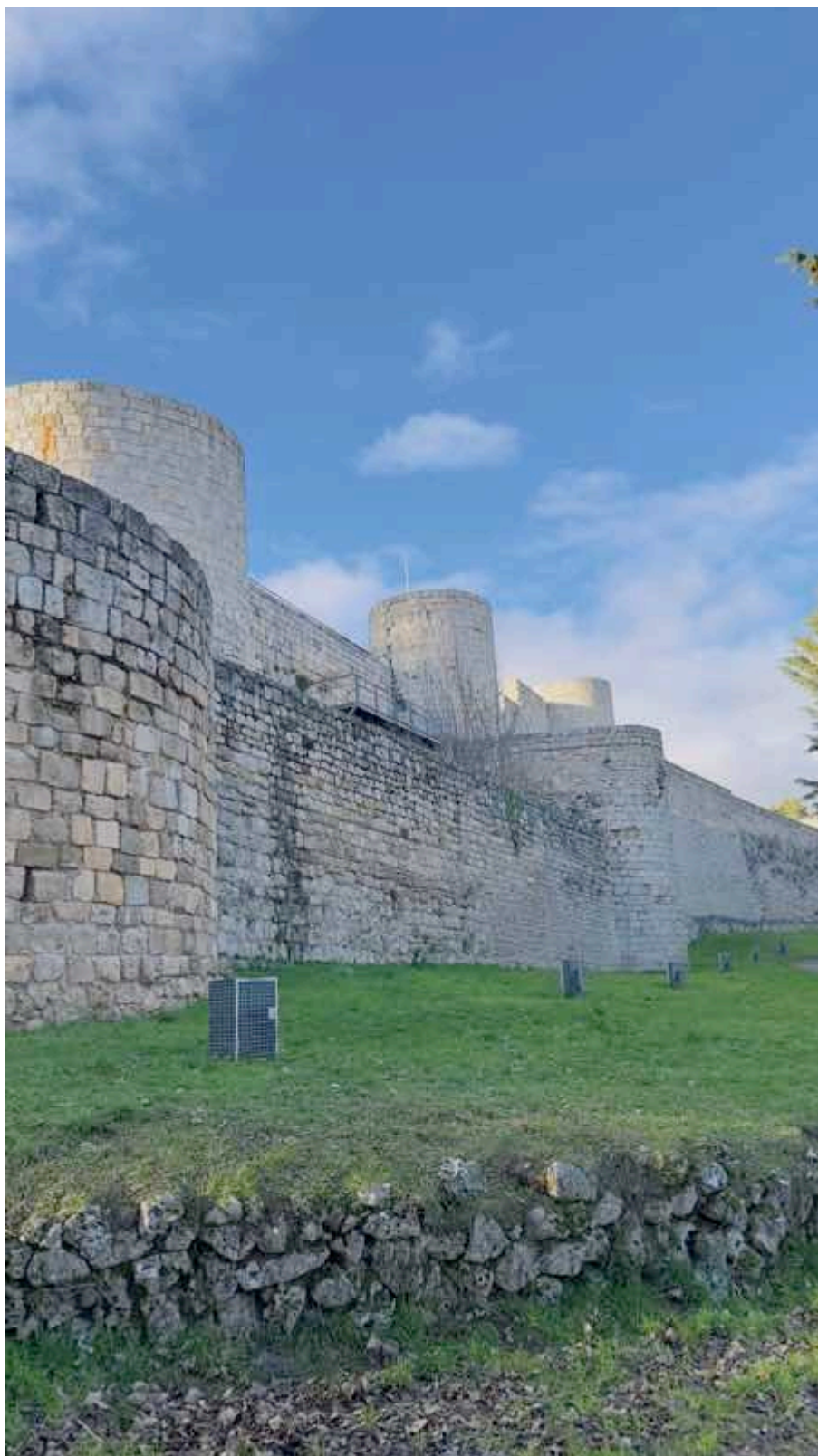
Resti del castello