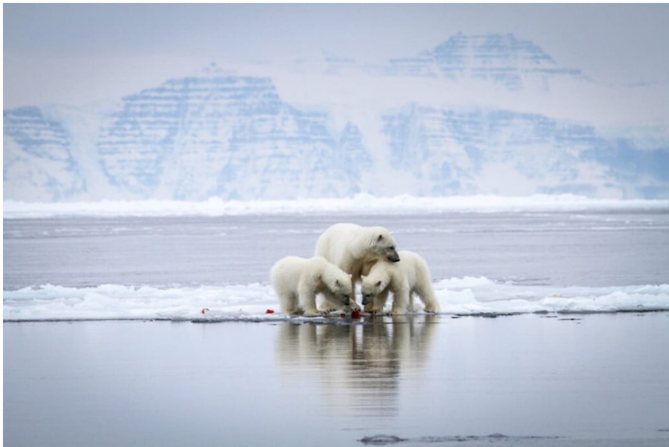
Foto: Martin Munck – Visita la Groenlandia. Madre di orso polare con 2 cuccioli curiosi nel nord-est della Groenlandia