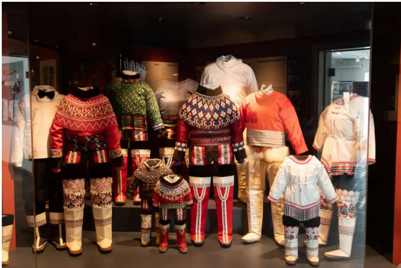
Esposizione dei diversi tipi di costume nazionale groenlandese al Museo Nazionale di Nuuk

Il costume nazionale è una parte importante dell'identità culturale della Groenlandia ed è indossato nella maggior parte delle principali celebrazioni (battesimi, primo giorno di scuola, cresima, matrimonio, funerale, ecc.) così come per i festival chiave come la Giornata nazionale, Natale e Pasqua.