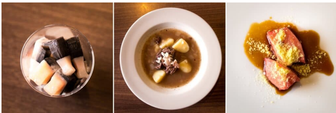
Alcuni dei cibi tradizionali della Groenlandia da L - R: mattak, suaasat, grasso di balena crudo

La dieta tradizionale in Groenlandia è dominata da tutto ciò che può essere cacciato o pescato. Per questo motivo renne, bue muschiato, foca, balena e pesce costituiscono la base dei cibi tradizionali. La suaasat (zuppa tipicamente a base di carne di foca e speziata con pepe, cipolle e alloro) è il piatto nazionale della Groenlandia, mentre il Mattak (pelle di balena) è una prelibatezza popolare.