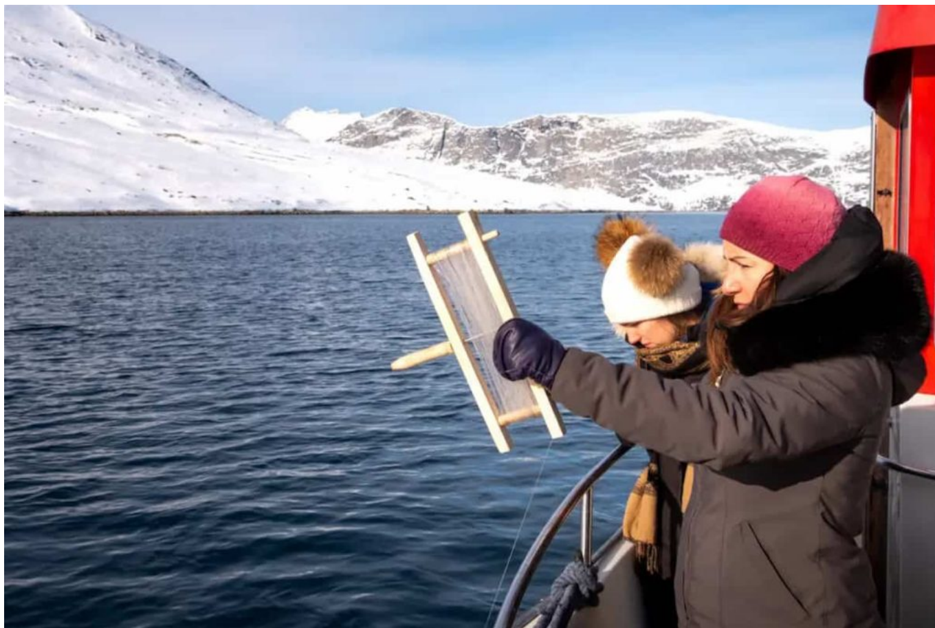
Pesca su un giro in barca nel fiordo di Nuuk

Groenlandia. Costituisce la maggior parte dei dollari di esportazione guadagnati ed è anche essenziale per lo stile di vita.