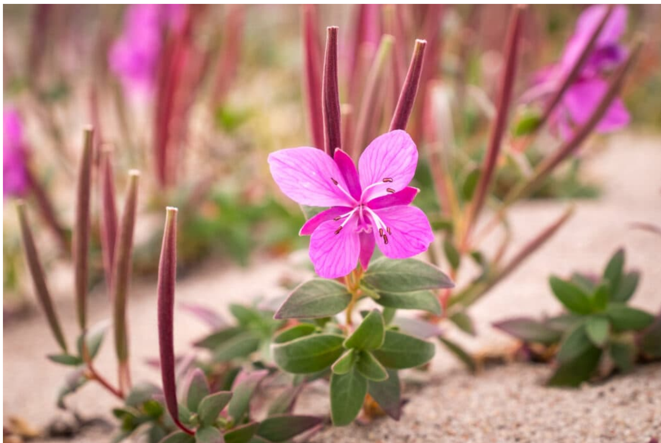
Nivarsiaq - il fiore nazionale della Groenlandia

Fiorisce tra giugno e settembre e si trova comunemente negli ambienti fluviali sabbiosi.