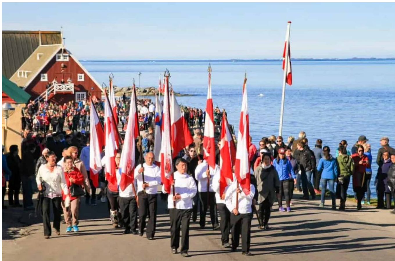
Sfilata della Giornata Nazionale della Groenlandia nel porto coloniale di Nuuk

Se sei in Groenlandia in questa data, puoi aspettarti molte bandiere, cibo, intrattenimento e persone vestite in costume nazionale. Alcuni luoghi organizzano anche una competizione, in cui i cacciatori ruggiscono sulle loro barche per essere i primi a tornare con un sigillo.