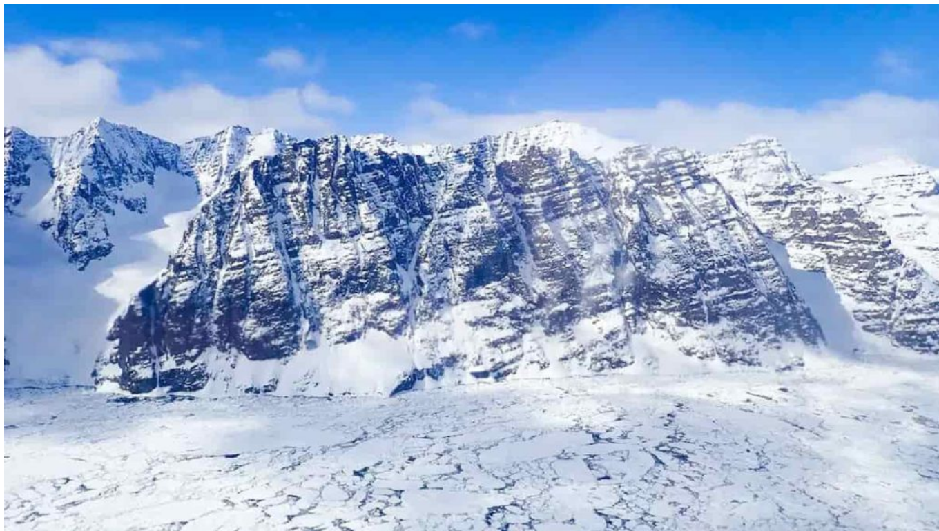
Mt. Gunnbjørn, la montagna più alta della Groenlandia, dalla linea centrale del ghiacciaio Kong Christian IV.

La stessa calotta glaciale della Groenlandia si trova in realtà a un'altitudine piuttosto elevata. Ha una media di circa 2.000 m sul livello del mare con il punto più alto di circa 3.300 m.