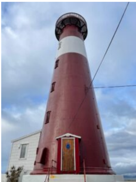
Arrivare al faro di Tranøy

La capitale (capoluogo amministrativo) è Bodø , che ne è uno dei 41 comuni ( kommuner ) ma il territorio più conosciuto della contea di Nordland ( Nordland Fylke ) -lunga circa 500 chilometri di costa frastagliata e ricca di isole, grandi medie e piccole, e isolotti- sono le isole Lofoten , conosciute ai più.