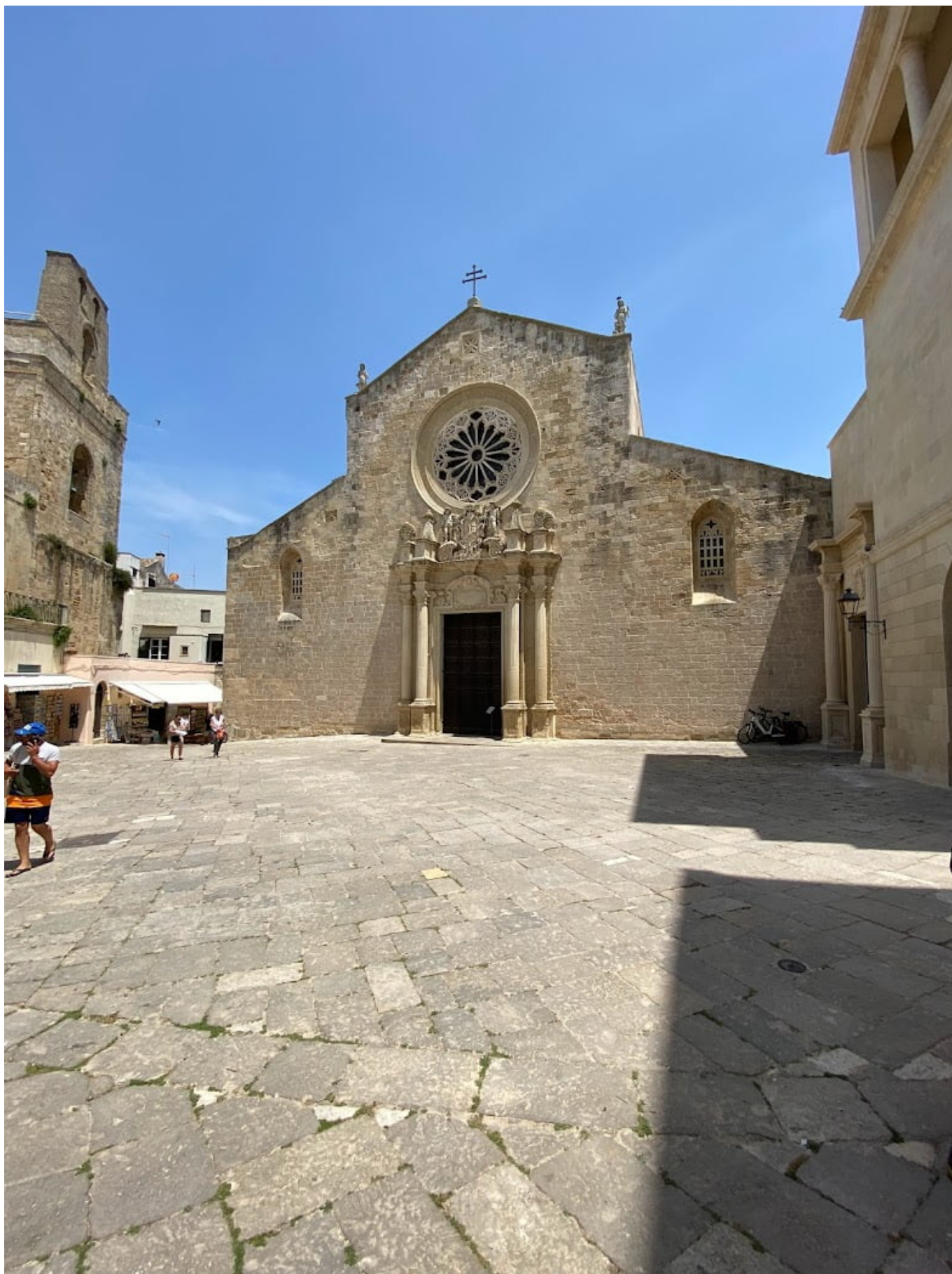
Cattedrale di Otranto

paleocristiano. Oggi conserva le spoglie degli 800 martiri uccisi per mano del feroce pascià. È a croce latina con uno splendido soffitto a cassettoni in legno color oro. Le pareti recano splendidi